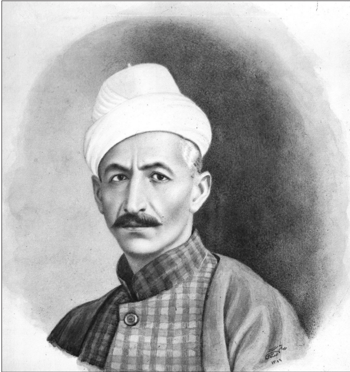
• پرتره عارف قزوینی، اثر رسام ارزشنگی

آن‌ها نمی‌دهم، اما با آشنایان یا عده کمی از دوستان خود چه کنم؟» (۱) و در یکی از مثنوی‌های بلندش به همین چند بیت قناعت کرد و گفت عارف‌نامه سبب شهرت ایرج شد؛ و گرنه نامی از او نمی‌ماند: